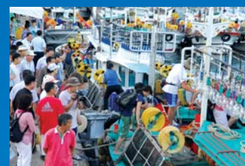
오징어 조업 체험 승선