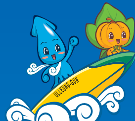
오징어 조업 체험 승선